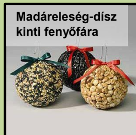
Madáreleség-dísz kinti fenyőfára