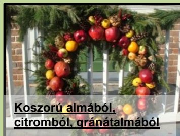
Koszorú almából, citromból, gránátalmából