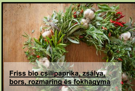
Friss bio csillipaprika, zsálya, bors, rozmaring és fokhagyma